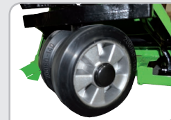
Nuevas ruedas Caucho macizo y llanta metálica