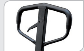
Empuñadura de caucho Mayor confort.