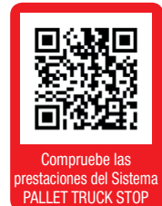
Compruebe las prestaciones del Sistema PALLET TRUCK STOP