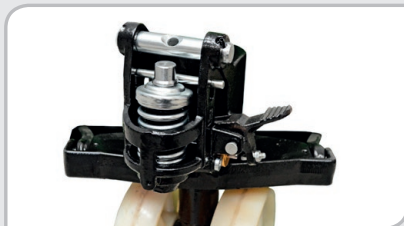
Grupo hidráulico sobredimensionado 2.500 kg. Protección del muelle. Pedal auxiliar de bajada.