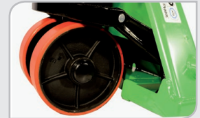
Fácil rodadura Diámetro de ruedas extragrande.