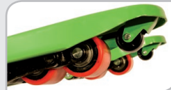
Doble tandem + rueda de ataque.