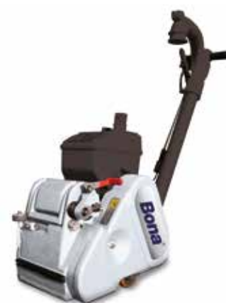
Bastidor y tambor

¿Va a transportar la máquina usted solo? Hágalo así: