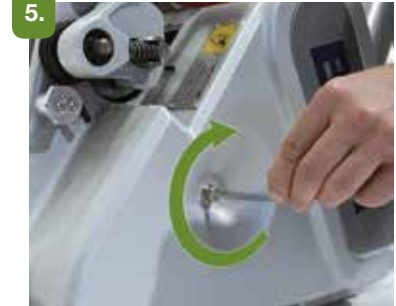
Cierre la protección de la correa y apriete el tornillo.