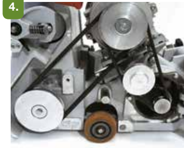
Ajuste y tense las correas.