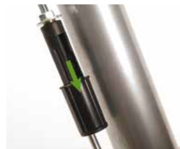
Coloque el tubo de succión (A) y el vástago de control del tambor (B).