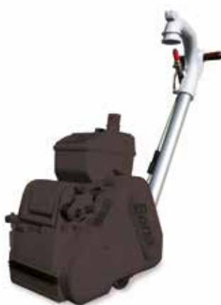
Tubo de succión/mango