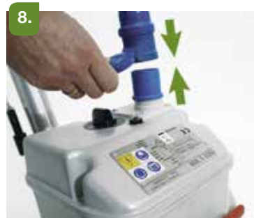
Conecte el cable de alimentación a la máquina y a la red.