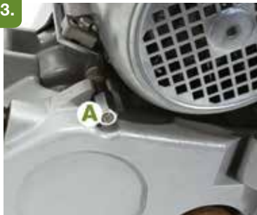
Asegure el motor apretando la manilla (A).