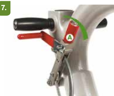
Levante el tambor con la palanca (A).