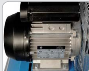
Motor eléctrico Potencia acorde a las dimensiones del cabezal, garantizando el caudal efectivo generado.