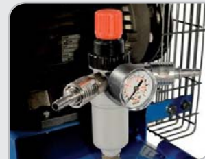
Regulador de presión Enchufes rápidos. Filtro de condensación. Manómetro.