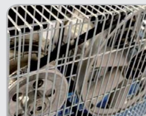
Malla metálica de protección Robustez y seguridad en nuestros equipos.